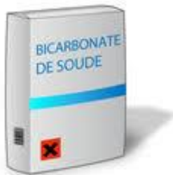
Illustration : bicarbonate de soude

Parsemer du bicarbonate de soude sur votre matelas et laisser agir une heure. Répétez l'opération sur l'autre face. Frotter légèrement l'ensemble du matelas. Passez l'aspirateur sur le matelas pour ne laisser aucun résidu. Additionner au bicarbonate de soude, quelques gouttes d'huile essentielle d'arbre à thé qui est un bon désinfectant naturel et qui parfumerait.