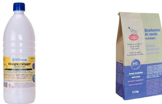
Illustration : vinaigre blanc + bicarbonate de soude