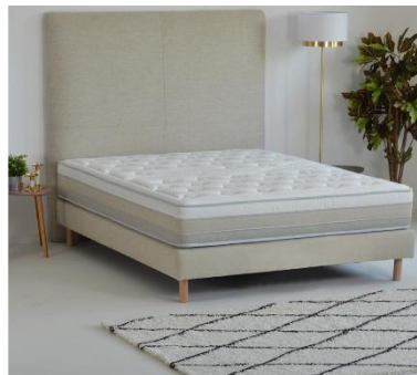
Matelas naturel Symphonie

Le matelas naturel Symphonie est un matelas constitué à 100 % de mousses Biologiques. Il contient de la mousse viscoélastique à mémoire de forme avec zonage de confort, de la mousse Haute Résilience au confort medium et de la mousse Haute Résilience au confort ferme. Toutes sont à base de soja non O.G.M. L'association de ces 3 mousses confère au matelas à la fois un confort extrême et un soutien exceptionnel. En effet, la mousse viscoélastique à mémoire de forme épouse votre morphologie, permettant réduction des maux de dos et amélioration de la circulation sanguine, tandis que les mousses Haute Résilience apportent de la fermeté au couchage pour un bon maintien du corps. Le soja est une matière naturellement antiacariens, particulièrement adaptée aux personnes sujettes à des allergies. Il est également très absorbant et composé de milliers de cellules ouvertes ce qui lui permet d'évacuer l'humidité liée à la transpiration et d'aérer le matelas pour une hygiène optimale de votre literie. La housse a, quant à elle, un coutil supérieur en viscose naturelle et viscose de bambou, une matière absorbante qui élimine les acariens et bactéries pathogènes. Son garnissage est en laine, coton et fibres pour un apporter moelleux et douceur au dormeur.