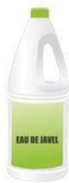
Illustration : eau de javel