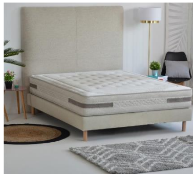
Matelas naturel Sérénade

Le matelas Sérénade est un matelas naturel qui réunit 3 technologies. Son âme est composée de ressorts ensachés, de fibres naturelles de coco et de latex 100 % naturel Bio. Les ressorts ensachés travaillent indépendamment et assurent au corps une suspension optimale ainsi qu'une totale indépendance de couchage. Ils sont également, en matière d'hygiène, la technologie la plus efficace grâce à l'aération sans égal qu'ils procurent au matelas. Les fibres de coco sont, quant à elles, très résilientes ce qui permet d'apporter de la fermeté au matelas et ainsi un bon soutien. Naturellement hypoallergéniques, antiacariens et ventilées, elles aident à réduire l'humidité et la condensation, renforçant l'hygiène déjà apportée par les ressorts. Le latex, lui, offre au matelas un confort exceptionnel grâce à son caractère ergonomique. Thermorégulant, c'est aussi une matière qui convient parfaitement aux personnes qui ont tendance à transpirer. Ces 3 merveilles sont enveloppées dans une housse elle aussi Bio, faite en surface de fibres naturelles de soja, de lin et de viscose de bambou et garnie de coton, de laine et de fibres.