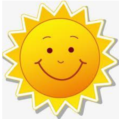
Illustration : soleil