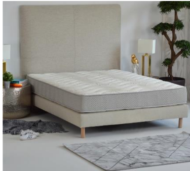
Matelas naturel Prélude

Le matelas naturel Prélude est un matelas en fibres Bio végétales. Son âme est composée de 18 cm de latex 100 % naturel et d'1 cm de fibres de coco. Ces deux matières en font un matelas à la fois confortable et hygiénique. En effet, le latex, en plus d'être thermorégulant, offre une ergonomie optimale ainsi qu'un soutien parfait du corps, renforcé par les fibres de coco très résilientes. Ces dernières, naturellement hypoallergéniques et antiacariens, sont également un excellent absorbeur d'odeur et très respirantes, offrant au matelas une bonne aération naturelle. Le tout est enveloppé dans une douce housse constituée de laine, thermo-isolante et absorbante, ainsi que de coton, hypoallergénique et naturellement antibactérien.