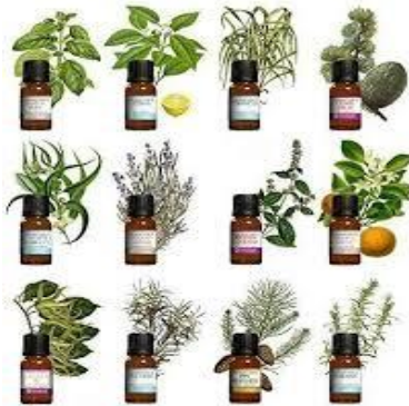
Illustration : huiles essentielles